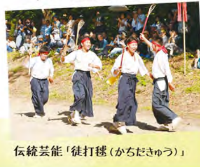
伝統芸能「徒打毬 (かちだきゅう)」