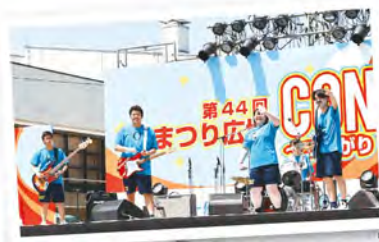
おまつり広場 ステージ出演! (軽音楽部・太鼓部)

学校をとり出し ボランティア活動にも 積極的に参加し、 地域の人々との交流を 楽しんでいます。